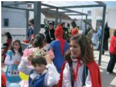
Escola do primeiro ciclo de Aldeia