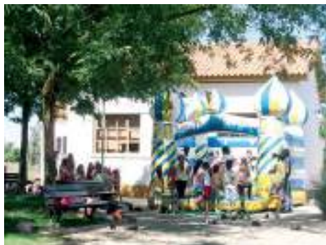
Jardim de Infância de Malpique