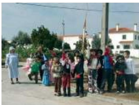
Escola do primeiro Ciclo de Malpique