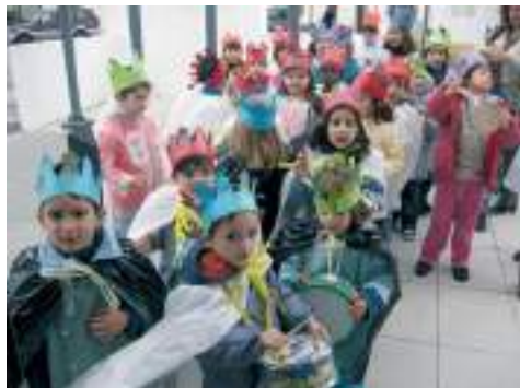
Jardim de Infância de Aldeia

enquanto os Homens quiserem e forem capazes. Nós, contribuindo para essa memória deixamos aqui nota de alguns momentos das actividades decorridas, neste último ano lectivo, nesses espaços escolares.