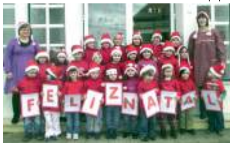
Jardim de Infância da Portela