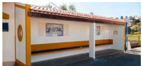
Pintura das paragens de autocarros e wc públicos