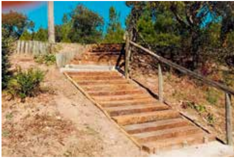
Melhoramento dos acessos à Fonte da Ti Ana - Pereira