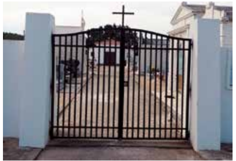
Portão Cemitério da Portela