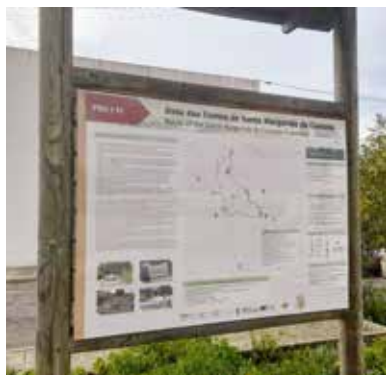
Rota das Fontes