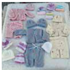
Oferta de Isabel Ramos Lageira e sua mãe