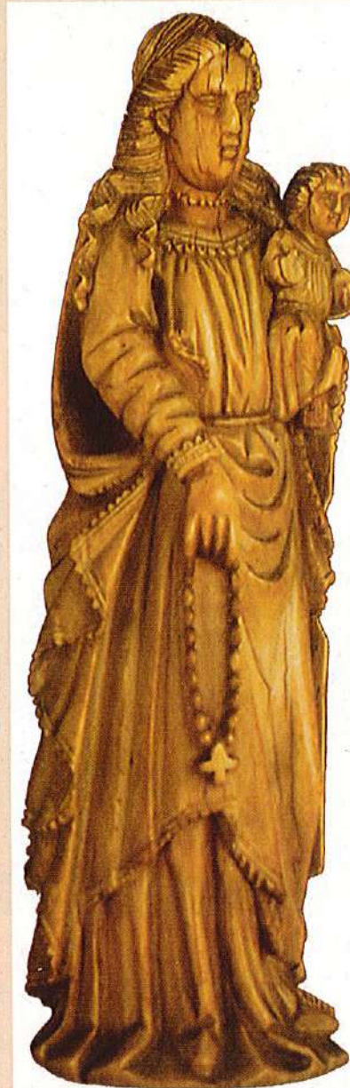
"Nossa Senhora do Rosário e o Menino Jesus". Marfim, século XVII, Museu do Xavier Centre of Historical Research, Alto Porvorim Goa"

Nota: A imagem apresentada não é a furtada da nossa freguesia, mas uma outra, apenas exemplificativa da forma como Nossa Senhora do Rosário se pode apresentar.