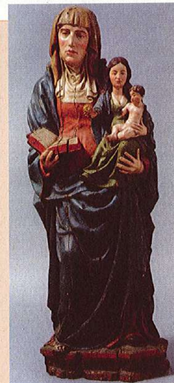
Santana Tríplice Igreja Matriz do Vimieiro - Sec. XVI

No final do século XV estas eram imagens muito populares especialmente na Alemanha e nos Países Baixos, estendendo-se essa popularidade à Península Ibérica em finais do século XV e inícios do século XVI. Este tipo de iconografia também costuma designar-se por Santana Tríplice. A título de exemplo e para uma maior clareza do exposto anteriormente apresenta-se a imagem seguinte