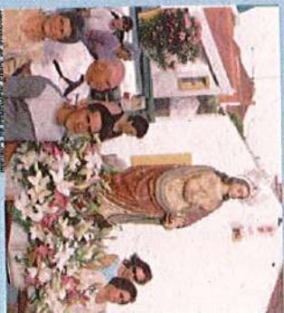
Fotografia de Santa Margarida da Coutada

22H45 - Actuação do Rancho Folclórico "Os Camponeses" de Malpique