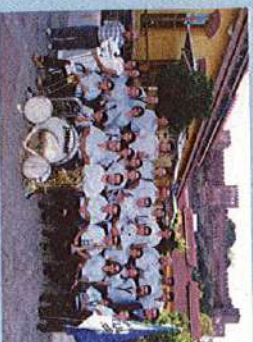
Banda da Associação Filarmónica 24 de Janeiro de Montalvo