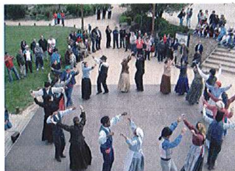
Tarde de Folclore