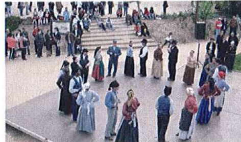
Tarde de Folclore