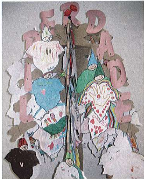
A Árvore da Liberdade