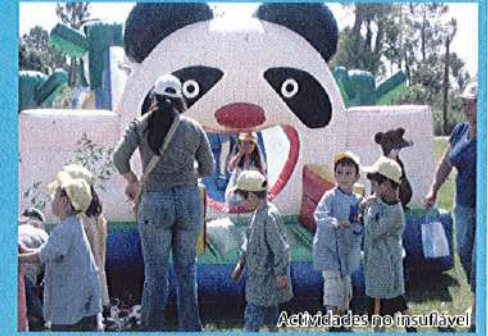
Actividades no Insuflável