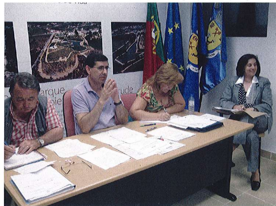
Assembleia de Freguesia de 25 de Junho