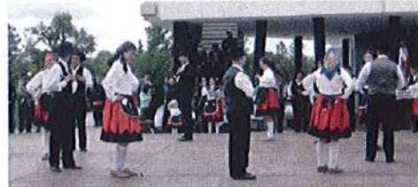
Tarde de Folclore