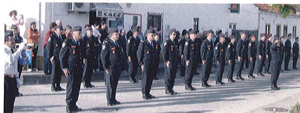
Os Bombeiros em parada