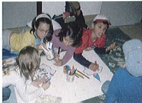
Actividades na Junta de Freguesia