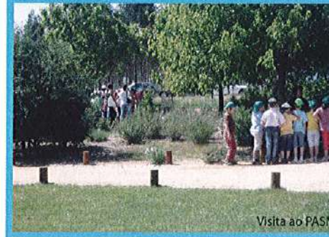
Visita ao PASM

Parque Ambiental, de um Insuflável, sempre tão do agrado da nossa criançada. Para que não faltasse a energia para os saltos e para a visita ao parque também com com muito gosto que a Junta de Freguesia ofereceu o lanche aos nossos "mais que tudo"!!