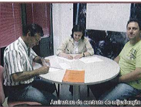
Assinatura de contrato de adjudicação

Como muitos de vós estarão lembrados, a Junta de Freguesia tem perspectivadas obras de requalificação do logradouro da Junta de Freguesia. O Contrato já foi assinado, pelo valor de 31.731,89 mais IVA, estando previsto para breve o início da intervenção.