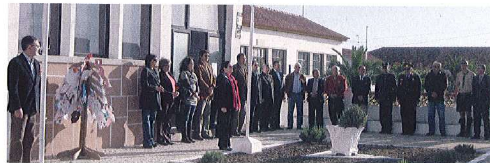
Cerimónia do içar da bandeira

Durante a semana que antecedeu a comemoração do dia 25 de Abril, a Junta de Freguesia desenvolveu, juntamente com os Jardins de Infância e as Escolas do Primeiro Ciclo da Freguesia, um conjunto de actividades onde se conversou e contaram histórias relativas ao 25 de Abril. As crianças também foram desafiadas a desenhar o seu conceito de liberdade, numa folha que veio a constituir aquilo a que chamámos “Árvore da Liberdade”.